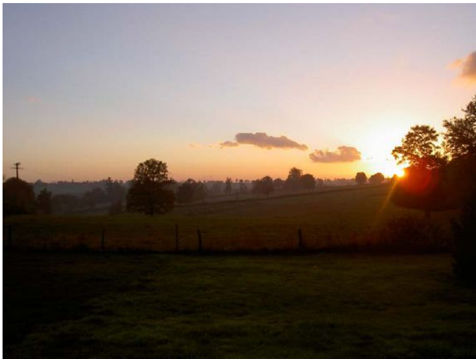
(coucher de soleil vu du jardin)